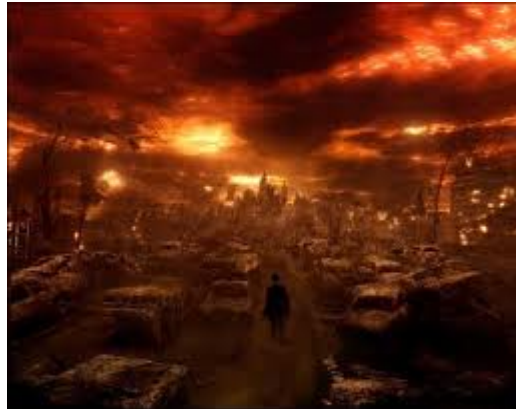
Vista del reino de Mordor, paraje de llamas y cenizas donde se reúne la CEOE(x)

No habiendo más asuntos que tratar, se levanta la sesión y los asistentes pasan a devorar unos asalariados afectados por Expediente de Regulación de Empleo.